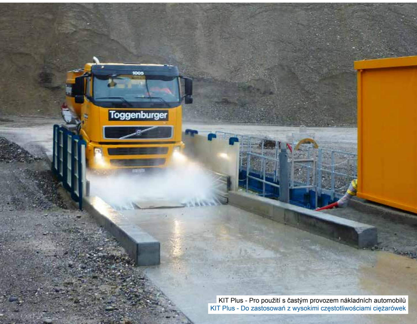
KIT Plus - Pro použití s častým provozem nákladních automobilů KIT Plus - Do zastosowań z wysokimi częstotliwościami ciężarówek

ConLine KIT Plus Linie se skládá z četného počtu mobilních a stacionárních zařízení na mytí pneumatik, které jsou vhodné především pro použití s častým provozem nákladních automobilů. Tyto moderní průjezdná zařízení vycházejí z naší více jak 30leté zkušenosti se zařízeními na mytí pneumatik a nabízejí vedle klasických předností produktu MobyDick také širokou paletu možností a atraktivní poměr ceny a výkonu. Všechna zařízení ConLine KIT Plus se snadno a jednoduše instalují a vyžadují pouze minimální údržbu. Linia ConLine KIT Plus obejmuje duży wybór mobilnych i stacjonarnych myjni opon, które nadają się szczególnie do pracy z dużą częstotliwością ciężarówek. Te nowoczesne systemy przejazdowe bazują na ponad 30-letnim doświadczeniu w zakresie systemów mycia opon i oprócz klasycznych zalet MobyDick oferują również szeroki zakres opcji i atrakcyjny stosunek ceny do wydajności. Wszystkie urządzenia ConLine KIT Plus są szybkie i łatwe w montażu i wymagają minimalnej konserwacji.