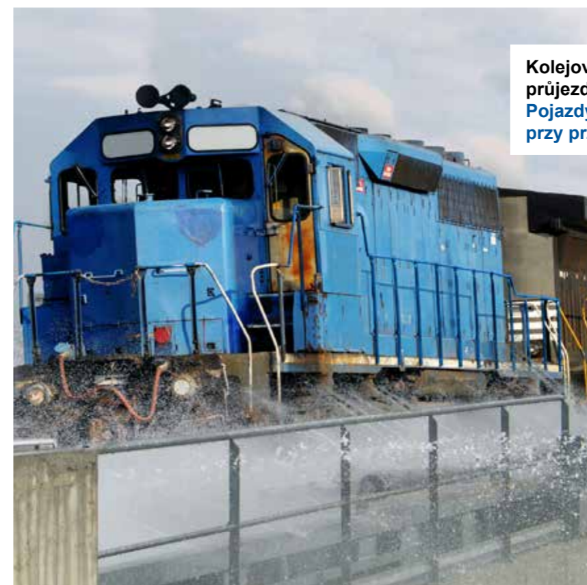
Kolejová vozidla: Intenzivní hrubé čištění při průjezdech Pojazdy szynowe: Intensywne czyszczenie zgrubne przy przejeździe

Co platí pro silnice, platí také na kolejích! Znečištěné nákladní vagony z elektráren, přecladišť nebo přístavů se musejí vyčistit, aby nedocházelo ke znečištění kolejí či k přetížení kartáčových mycích zařízení. To, co dotyczy dróg, dotyczy również kolei! Brudne wagony towarowe z elektrowni, centrów przeladunkowych lub portów morskich powinny być czyszczone tak, aby nie zanieczyszczały sieci kolejowej i nie przeciążyły systemów mycia szczotek.