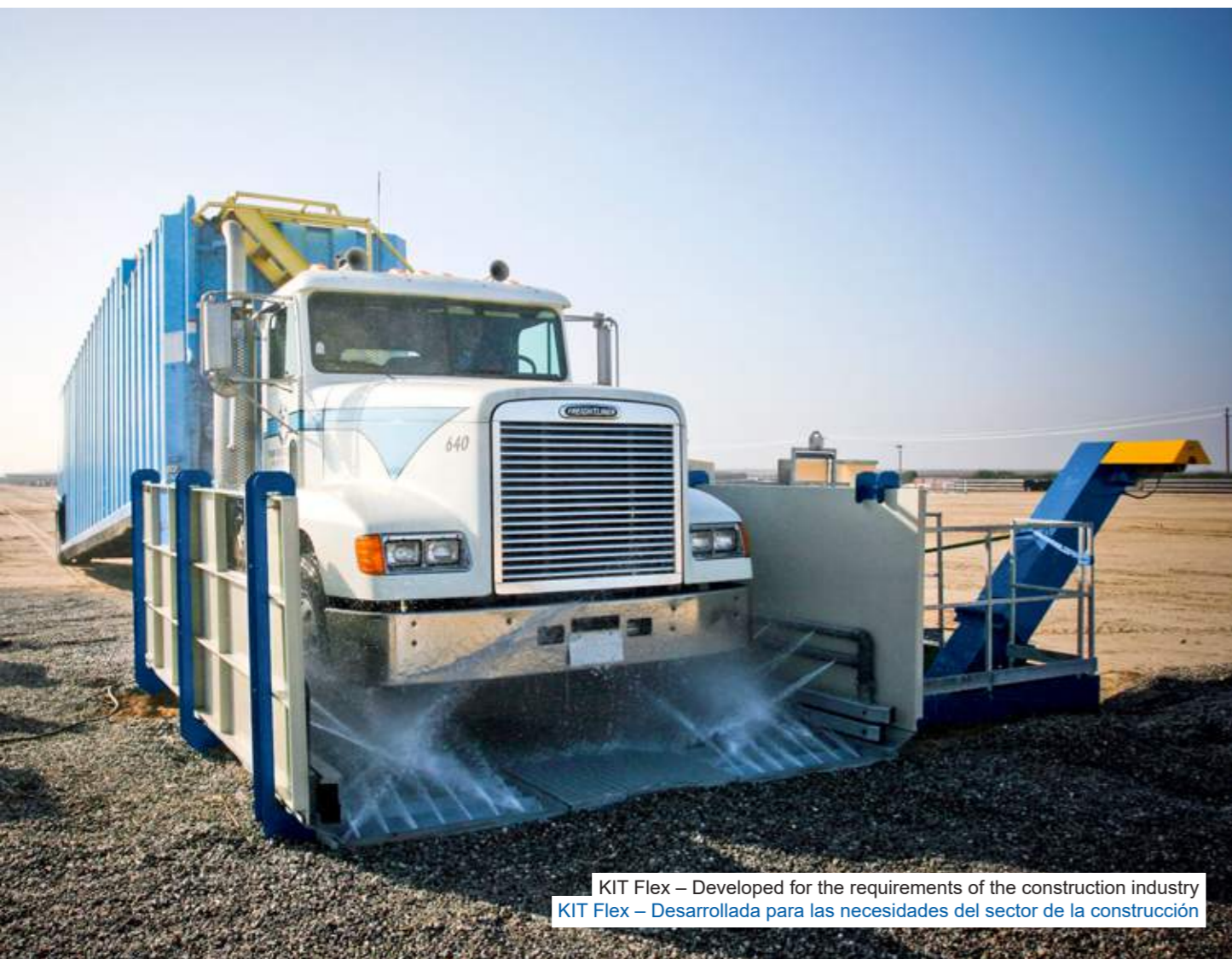
KIT Flex – Developed for the requirements of the construction industry KIT Flex – Desarrollada para las necesidades del sector de la construcción

The wheel washing systems of the ConLine KIT Flex line were specially developed for the needs of the construction industry by our engineers. The basic unit of the modular concept consists of a robust, four-meter-long washing unit and a recycling tank. It can be combined with a scraper conveyor, a mobility package, or a second basic unit to create eight different wheel washing systems with lengths of four or eight meters. All models can be installed quickly, and thousands of operators around the world are enthusiastic about them. Los sistemas de lavado de neumáticos de la ConLine KIT Flex fueron desarrolladas por nuestros ingenieros especialmente para las necesidades de la industria de la construcción. La unidad básica del concepto modular consiste en una robusta unidad de lavado de cuatro metros de largo y un tanque de reciclaje. Puede combinarse con un transportador de rasquetas, un paquete de movilidad o una segunda unidad base para formar ocho sistemas diferentes de lavado de neumáticos con longitudes de cuatro u ocho metros. Todos los modelos pueden instalarse rápidamente e impresionan a miles de operadores de todo el mundo.